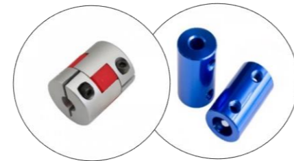
کوپلینگ سادو یا صنعتی