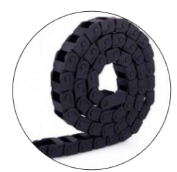
انرژی کلید محافظ کابل