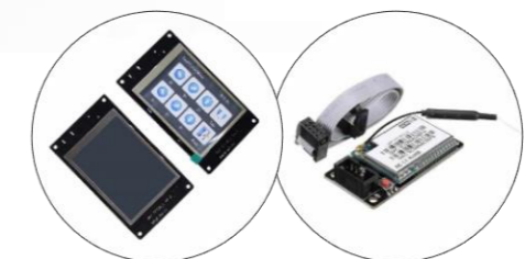
نمایشگر رنگی لمسی ۳.۲ اینچ با SD کارت و ماژول WiFi