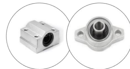
شفت هارد کروم و یاتاقان و بلبرینگ خطی ۱۶ میلی‌متر