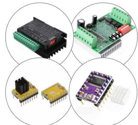
درایور استپر موتور ۱/۱۶ و ۱/۳۲ و ۱/۱۲۸ لیترنال و یا اکسترنال