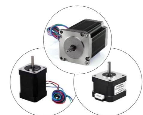
استپر موتور ۱۸ و ۱۷ و ۲۳ میلی‌متر Nema