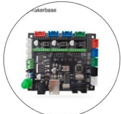
برد کنترل سه و یا چهار محور با خروجی لیزر و فرز